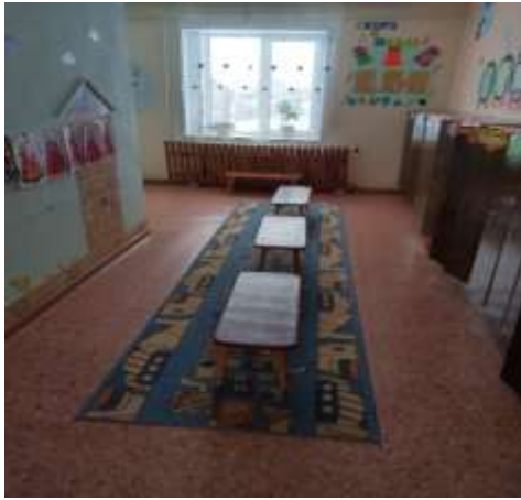
Фото №3 Коридор