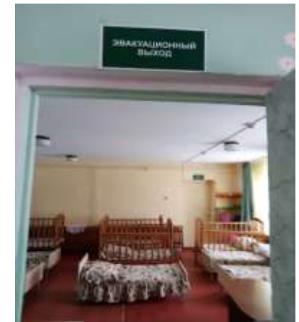
Фото №6 Пути эвакуации