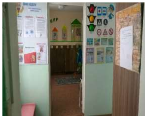
Фото №10 Гардероб