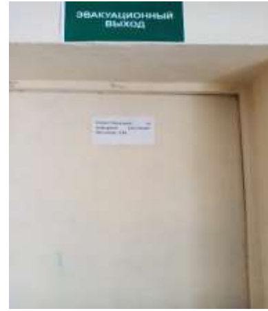
Фото №5 Пути эвакуации