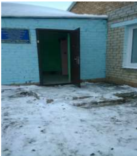
Фото №2 Входная площадка, дверь входная, тамбур