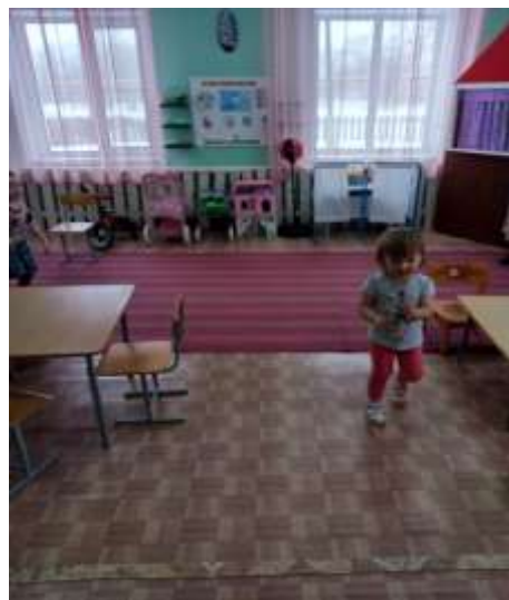
Фото №7 Кабинетная форма обслуживания