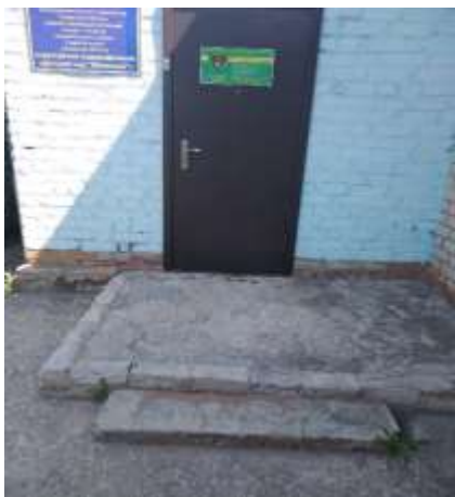
Фото № 11 Визуальные средства