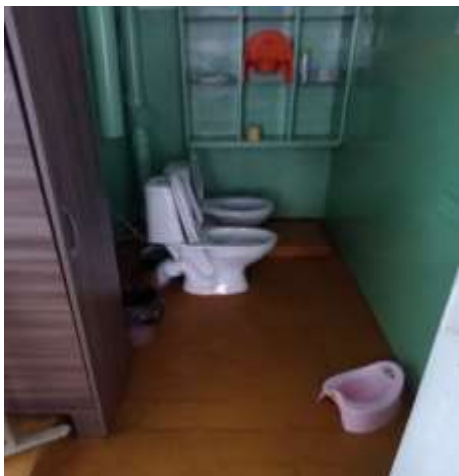
Фото №8 Туалетная комната