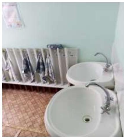
Фото №9 Туалетная комната