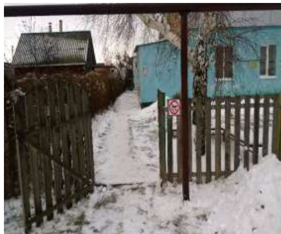
Фото №1а Вход на территорию, автостоянка