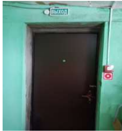
Фото №4 Пути эвакуации