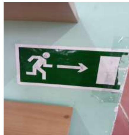
Фото № 13 Визуальные средства