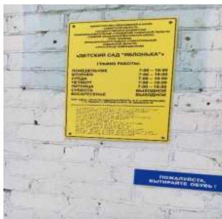
Фото № 12 Визуальные средства