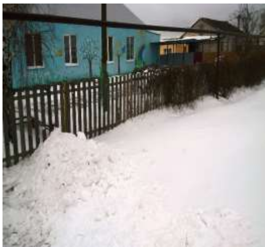
Фото №1 Вход на территорию, автостоянка